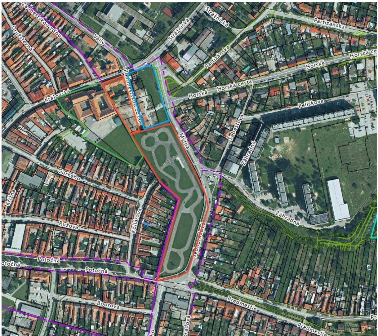
Obr. č. 4

Červená čiara - územie určené pre mestský park